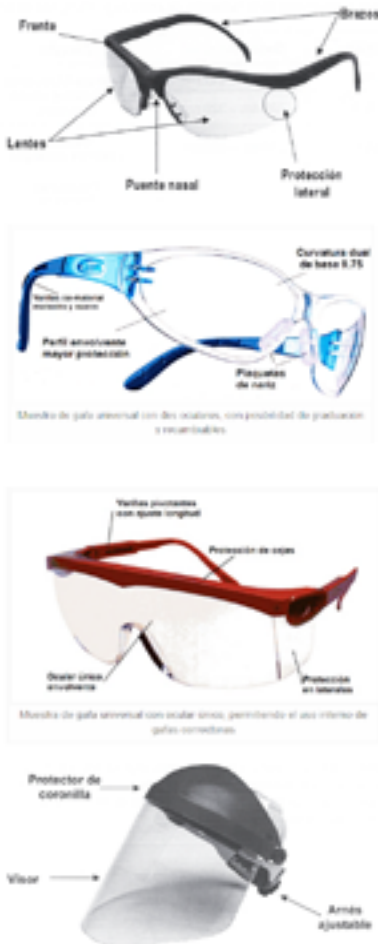
Figura 1. Partes de unas gafas de seguridad

que se necesite en un trabajo específico. La variación de estas partes puede llegar a constituirse en uno de los criterios de selección de importancia en los protectores visuales. La siguiente figura describe las partes de unas gafas de seguridad.